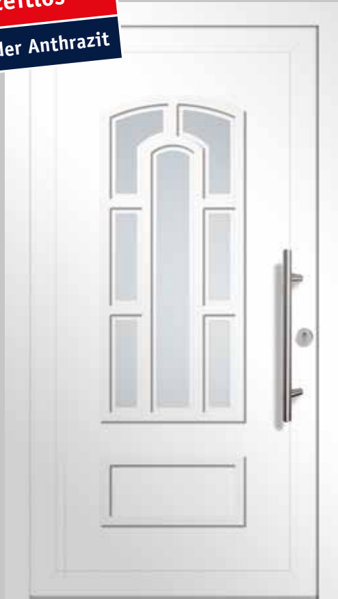
Typ AKS81104 | Einsatzfüllung | Verkehrsweiß ähnl. RAL 9016 | Stangengriff S 1020, 600 mm | Edelstahl-Rundrosette | Klarglas | Lichtausschnitt 420 mm x 1090 mm

Klassisch und zeitlos In Weiß oder Anthrazit