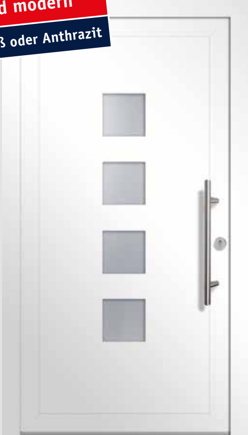
Typ A04400 | Einsatzfüllung | Verkehrsweiß RAL 9016 | Stangengriff S 1020, 600 mm | Edelstahl-Rundrosette | Ornamentglas Chinchilla | Lichtausschnitt 4 x 206 mm x 206 mm

Puristisch und modern In Weiß oder Anthrazit