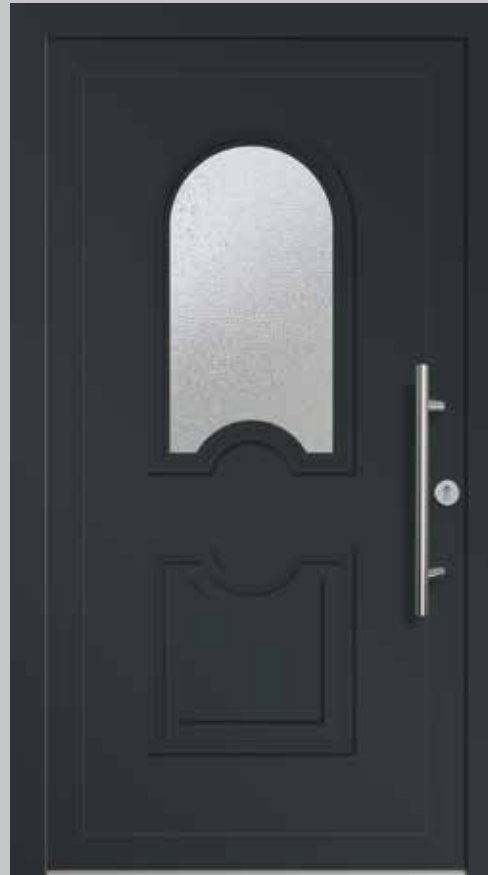
Typ AKS81114 | Einsatzfüllung | Anthrazitgrau RAL 7016 foliert | Stangengriff S 1020, 600 mm | Edelstahl-Rundrosette | Ornamentglas Chinchilla | Lichtausschnitt 408 mm x 768 mm