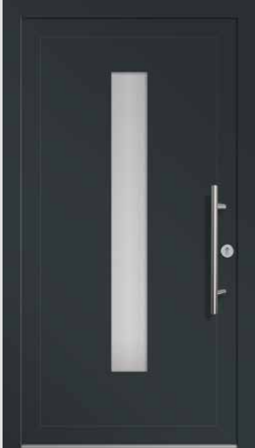
Typ A01208 | Einsatzfüllung | Anthrazitgrau RAL 7016 | Stangengriff S 1020, 600 mm | Edelstahl-Rundrosette | Ornamentglas Mastercarré | Lichtausschnitt 170 mm x 1400 mm