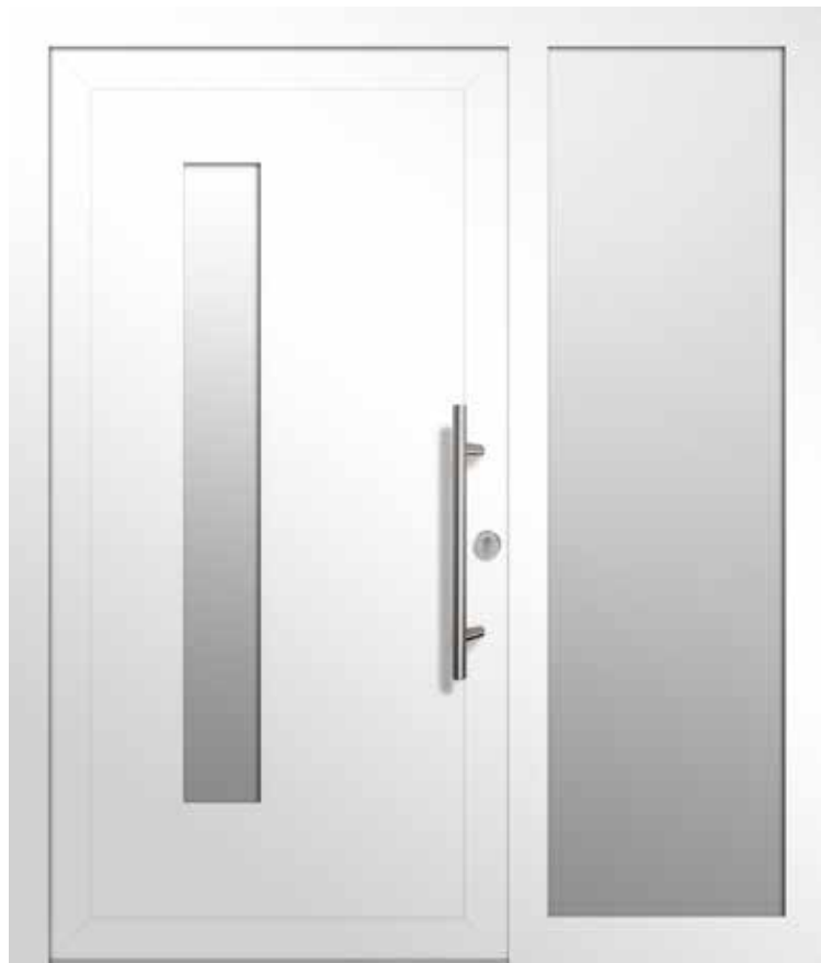
Typ A01240 | Einsatzfüllung | Verkehrsweiß RAL 9016 | Stangengriff S 1020, 600 mm | Edelstahl-Rundrosette | Ornamentglas Satinato | Lichtausschnitt 170 mm x 1400 mm