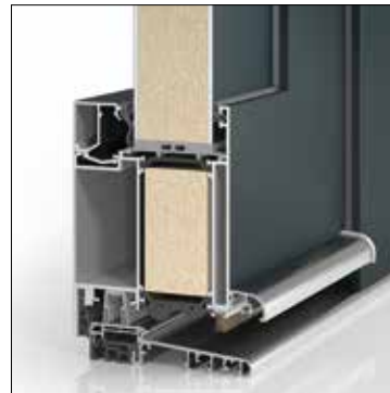
Aluminium-Haustür PaXentrée | Bautiefe 87 mm | thermisch getrennt