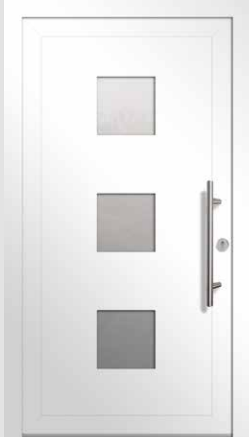
Typ A04308 | Einsatzfüllung | Verkehrsweiß RAL 9016 | Stangengriff S 1020, 600 mm | Edelstahl-Rundrosette | Ornamentglas Satinato | Lichtausschnitt 3 x 280 mm x 280 mm