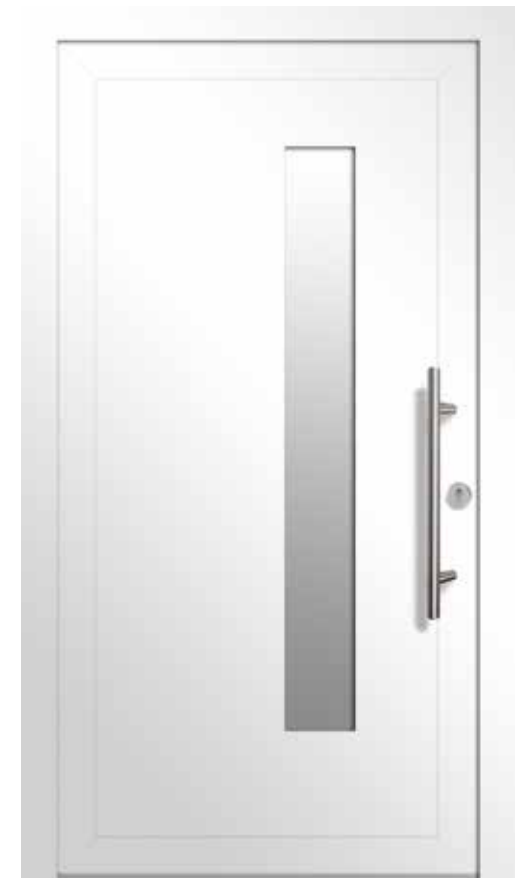
Typ A01230 | Einsatzfüllung | Verkehrsweiß RAL 9016 | Stangengriff S 1020, 600 mm | Edelstahl-Rundrosette | Ornamentglas Satinato | Lichtausschnitt 170 mm x 1400 mm

Natürlich liefern wir Ihnen auch Ihr individuelles Seitenteil und Oberlicht nach Maß.