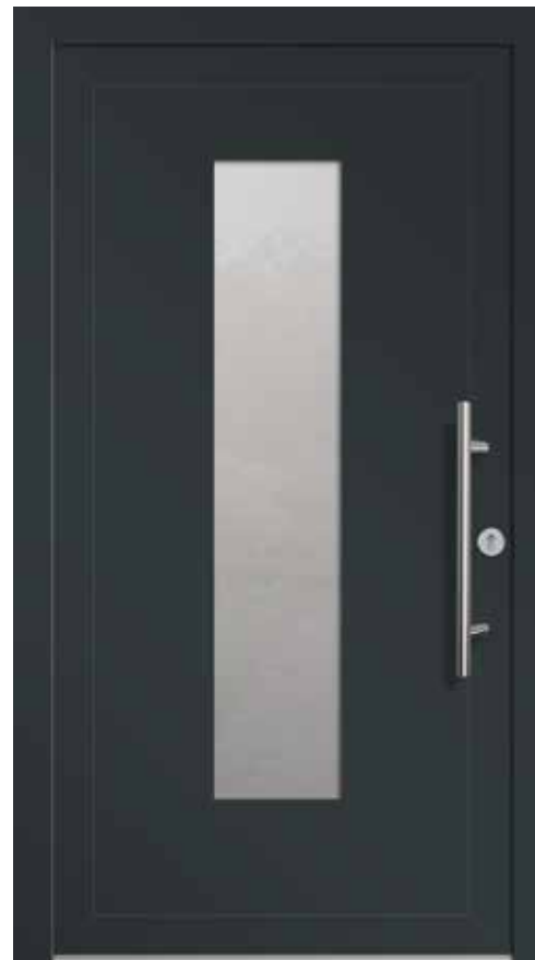
Typ A01608 | Einsatzfüllung | Anthrazitgrau RAL 7016 | Stangengriff S 1020, 600 mm | Edelstahl-Rundrosette | Ornamentglas Satinato | Lichtausschnitt 280 mm x 1400 mm