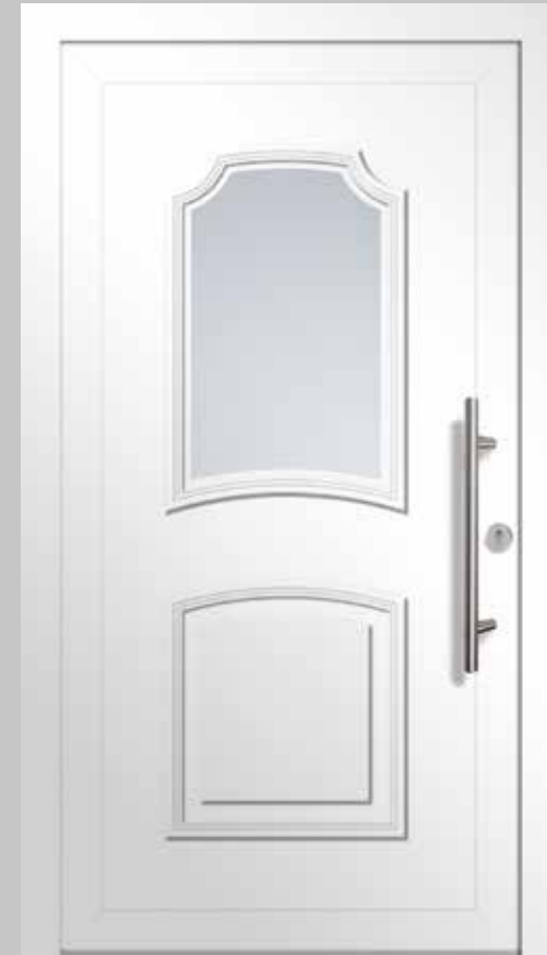
Typ AKS81124 | Einsatzfüllung | Verkehrsweiß ähnl. RAL 9016 | Stangengriff S 1020, 600 mm | Edelstahl-Rundrosette | Ornamentglas Satinato | Lichtausschnitt 408 mm x 670 mm