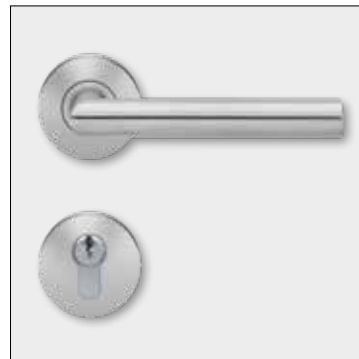
D_0000 | Edelstahl-Innendrücker „L-Form“ mit rundem Griff- und Profilzylinder-Beschlag.