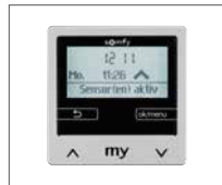
Zeit-, Wind- und Sonnenautomatik