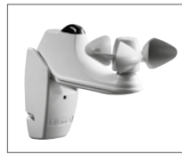
Wind- und Sonnensensor

Zusätzlich können LED-Lichtleisten an den Unterdachmarkisen angebracht werden, so sind Sie unabhängig von Wetter und Lichtverhältnissen.